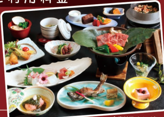
※会席料理イメージ